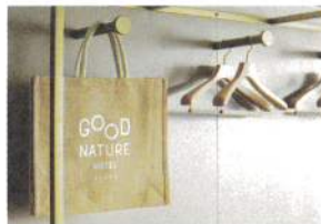
館内のお買回りやお出かけに使える オリジナルショッピングバッグ