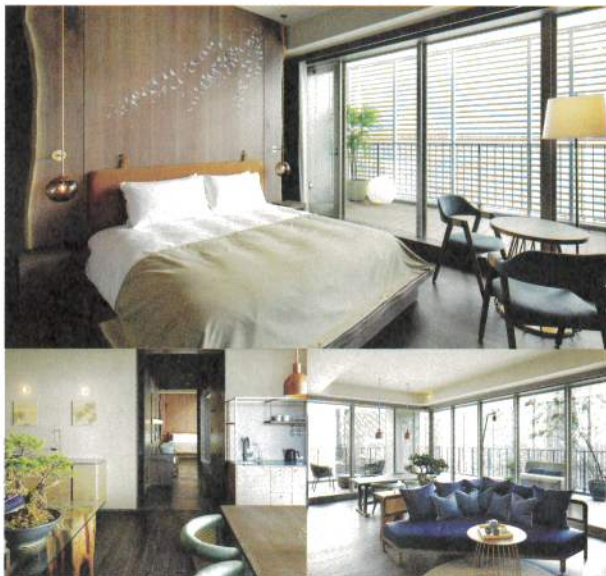
The Good Nature Suite ザ・グッドネイチャースイート