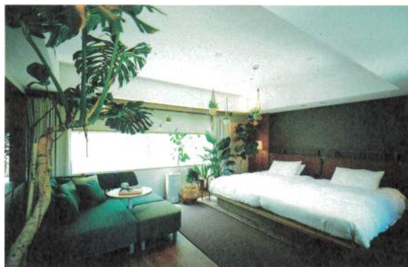
Botanical Room ボタニカルルーム