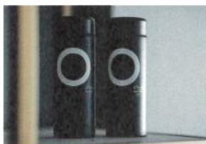
客室設置のタンブラー。各階設置の ウォーターサーバーでいつでも給水可能