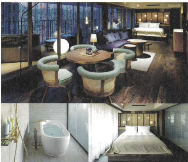
Higashiyama Terrace Suite 東山テラススイート