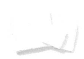
オーガニックコットン100%タオル