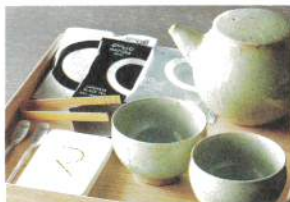
清水焼茶器セット/有機和紅茶など/ オリジナルウェルカムスイーツ