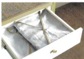
2重ガーゼが心地よいルームウェア (上下セット)