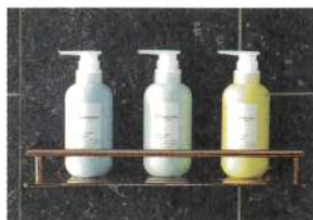
オリジナルオーガニックバスアメニティ